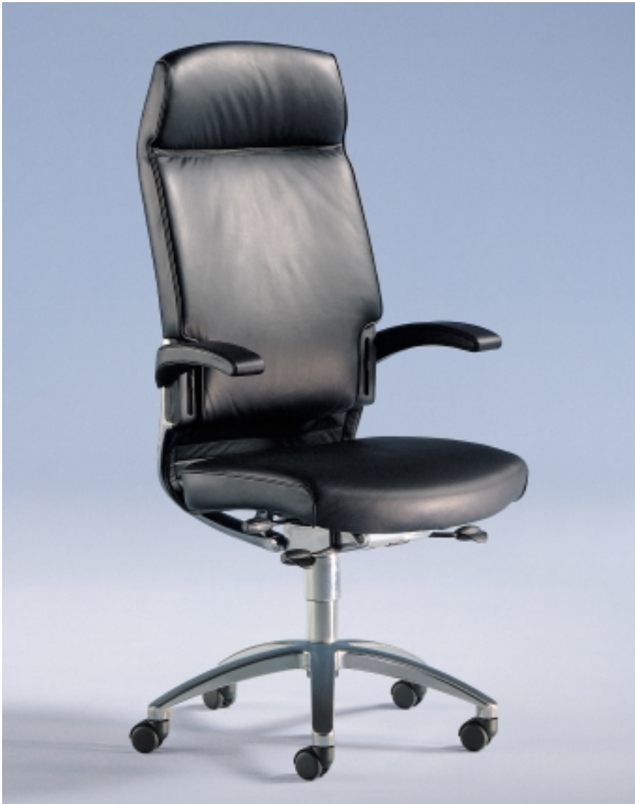
cambio XXL DHLT

Sitzhöhenverstellung: durch Drabert-Höhenmatic-Säule mit zusätzlicher Komfort-Tiefenfederung auch in unterster Stellung.